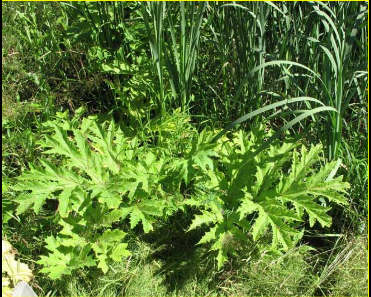
berce du Caucase