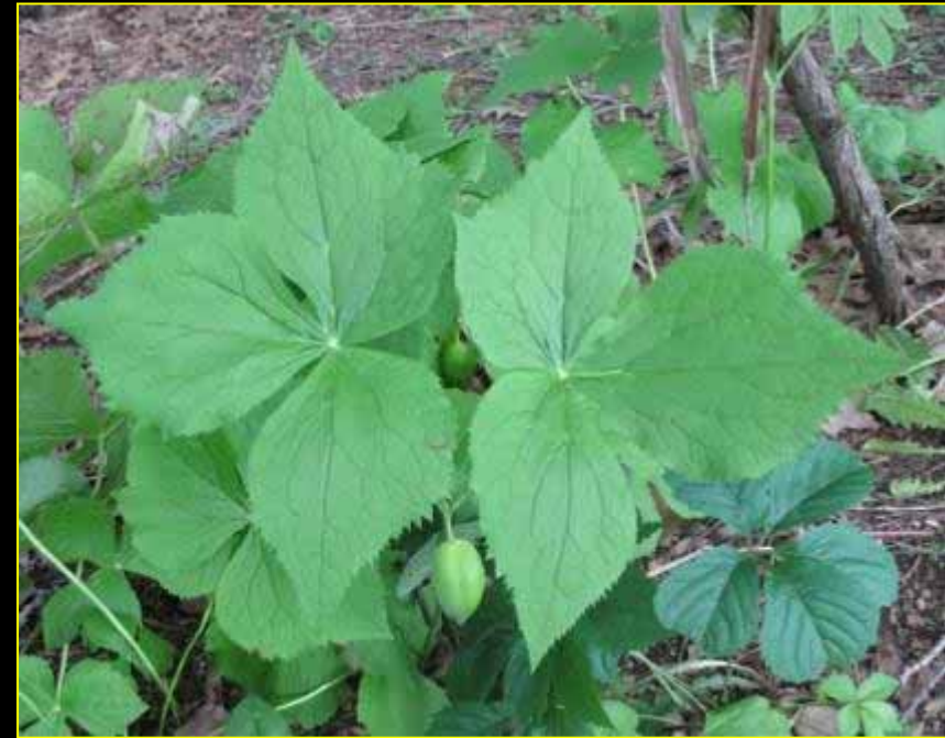
Podophyllum peltatum Linnaeus

« Il y a force vignes et prunes, qui sont très bonnes, framboises, fraises, petites pommes sauvages, noix, et une manière de fruit, qui est de la forme et couleur de petits citrons , et en ont aucunement le goût, mais le dedans est très bon, est presque semblable à celui des figues. C'est une plante qui les porte, laquelle a la hauteur de deux pieds et demi, chacune plante n'a que trois à quatre feuilles pour le plus, et de la forme de celle du figuier, et n'apporte que deux pommes chacun pied. Il y en a quantité en plusieurs endroits, et en est le fruit très beau et de bon goût. »