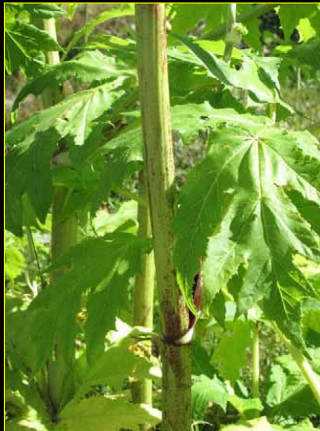
berce du Caucase